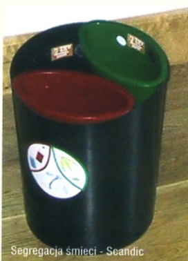
Segregacja śmieci - Scandic

Jeżeli oferowane są co najmniej dwa produkty spożywcze pochodzenia lokalnego przy każdym posiłku (łącznie ze śniadaniem) obiekt może ubiegać się o przyznanie dodatkowego punktu.