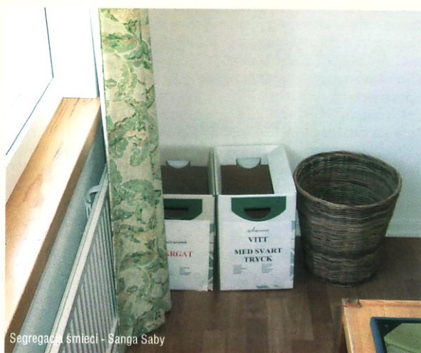
Segregacja śmieci - Sanga Saby

Jeżeli obiekt jest zarejestrowany w rejestrze EMAS automatycznie dostaje 3 punkty, za certyfikat ISO 14001 przynajmniej 1,5 punktu.