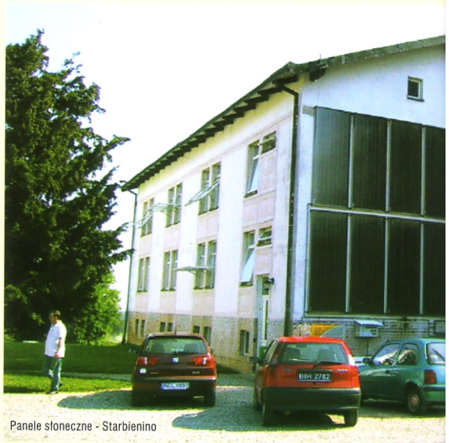
Panele słoneczne - Starbienio

Pralki używane na terenie obiektu, lub przez firmę zakontraktowaną do prania bielizny hotelowej powinny zużywać nie więcej niż 12 litrów wody na kilogram prania, zgodnie z pomiarami według normy EN 60456:1999, przy użyciu standardowego cyklu prania bawełny w temperaturze 60°C jak określono w Dyrektywie 95/12/EC – 1 punkt. W celu uzyskania kolejnego punktu co najmniej 80% kranów na terenie